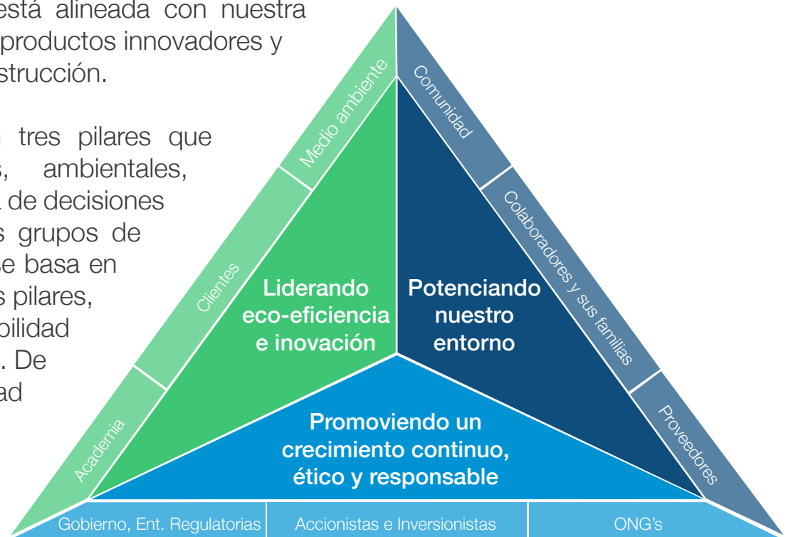
Estrategia de Sostenibilidad de Tecnoglass Inc.

La estrategia está fundamentada en tres pilares que consideran las variables sociales, ambientales, económicas y de gobierno para la toma de decisiones y la creación de valor para todos los grupos de interés de la organización. El modelo se basa en 16 compromisos, agrupados en los tres pilares, que buscan garantizar que la sostenibilidad esté integrada en todo nuestro negocio. De esta forma, la estrategia de sostenibilidad es una hoja de ruta clara para abordar nuestros principales impactos, consolidar nuevos estándares y lograr nuestros objetivos.